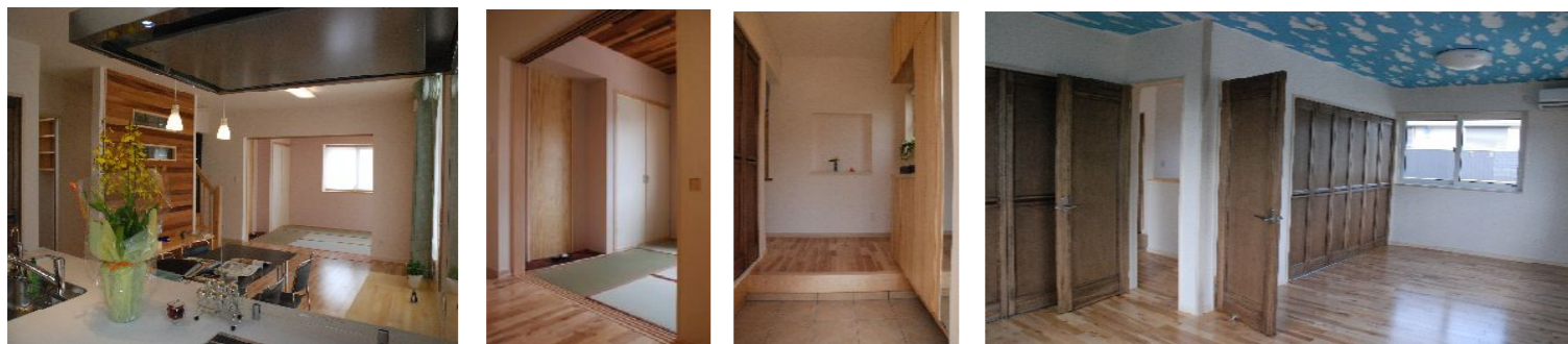
P4;かんたん 省エネライフ!